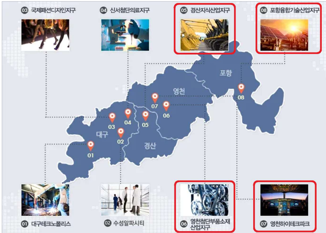
<경제자유구역(경북지구) 4개 지구 위치도>